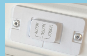
Interruptor de temperatura de color

Ya no hay necesidad de preocuparse por los paquetes lumínicos o las temperaturas de color: siempre es el mismo producto y la adaptación a su aplicación se puede realizar directamente in situ: