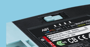
Interruptor de salida de lúmenes