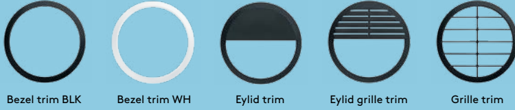
Bezel trim BLK