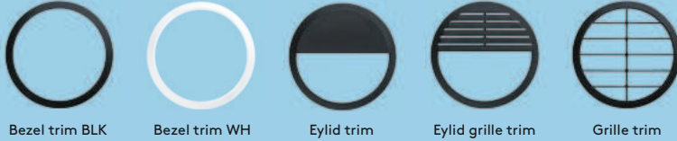
Bezel trim BLK