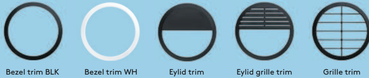
Bezel trim BLK