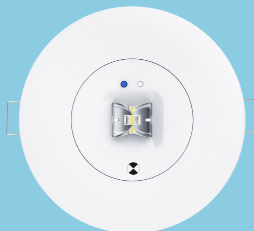
VIE DI FUGA