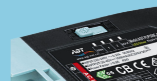
Variatore di flusso