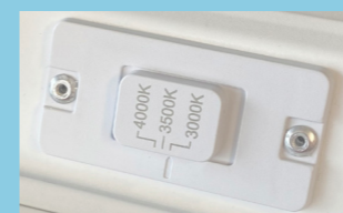
Selettore di temperatura colore

I pacchetti lumen o le temperature colore non devono più essere decisi in anticipo; può essere usato lo stesso prodotto da adattare direttamente in loco in base alle esigenze specifiche: